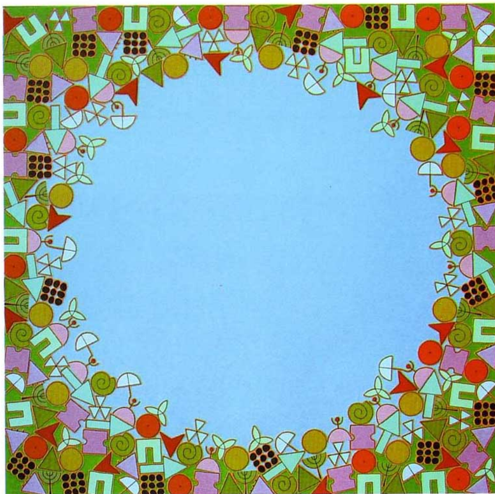
Círculo de luz 2005 Acrílico sobre lienzo 125 x 125 cm