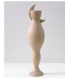
2.- AMPARO CARBONELL TATAY Venus del Desierto , 2012 Talla de fusta de til·ler 35 x 8 x 14 cm. 500 gr. Eixida: 300 €