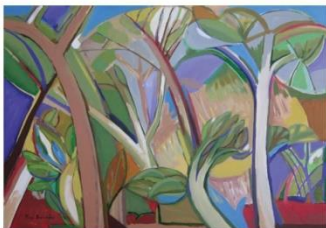
7.- CARLOS PÉREZ-BERMÚDEZ Bosque del toro nº 3 , 2011 Acrílic sobre llenç 70 x 100 cm. Eixida: 500 €