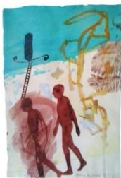
5.- ARTUR HERAS Camins al Sàhara , 2014 Acrílic i tinta sobre paper 80,5 x 55,5 cm. Eixida: 1.500 €