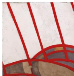
10.- CAROLINA MAESTRO De Derain , 2011 Acrílic sobre taula 122 x 122 cm. Eixida: 1000 €