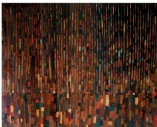
8.- CARMEN GRAU "PIEL -XXXI" , 2011 (sèrie " desde la piel ". 2004 -14) Tècnica mixta. Collage, pells, acrílic 96 x 124 cm. Eixida: 2.000 €