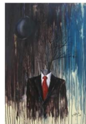
12.- DANIEL RAMOS Banquero. De la sèrie Banqueros , 2010 Acrílic sobre llenç 100 x 73 cm. Eixida: 250 €