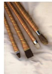
4.- ANTONI MIRÓ País valencià , 2008 Litografia sobre paper 75 x 56 cm. Eixida: 300 €