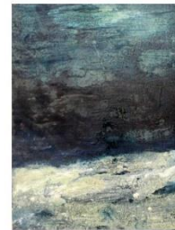
3.- AMPARO TORTONDA Más allá del Horizonte , 2009 Tècnica mixta sobre taula 50 x 65 cm. Eixida: 300 €