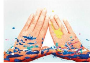
1.- ADRIÀ PINA MANS, la vela , 2007 Serigrafia sobre paper 49,5 x 71 cm. Eixida: 300 €