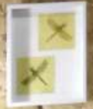
Information card with text.