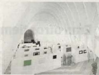
Llotja de Sant Jordi, edificio diseñado por Calatrava. LP

ticos) y el literario (27 poetas). He visto la exposición no personalmente, sino en una edición virtual, con una cámara que recorre, en un largo travelling, los paneles instalados en el imponente edificio diseñado por Santiago Calatrava, paneles que acotan espacios y en los que se exponen las obras, acompañadas en el video por la voz de Ovidi Montllor (Alcoi, 1942-1995) y la canción 'El meu poble'.