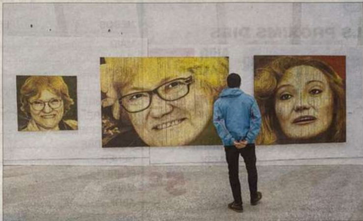
L'exposició es pot veure a la Llotja Sant Jordi fins a finals d'abril.